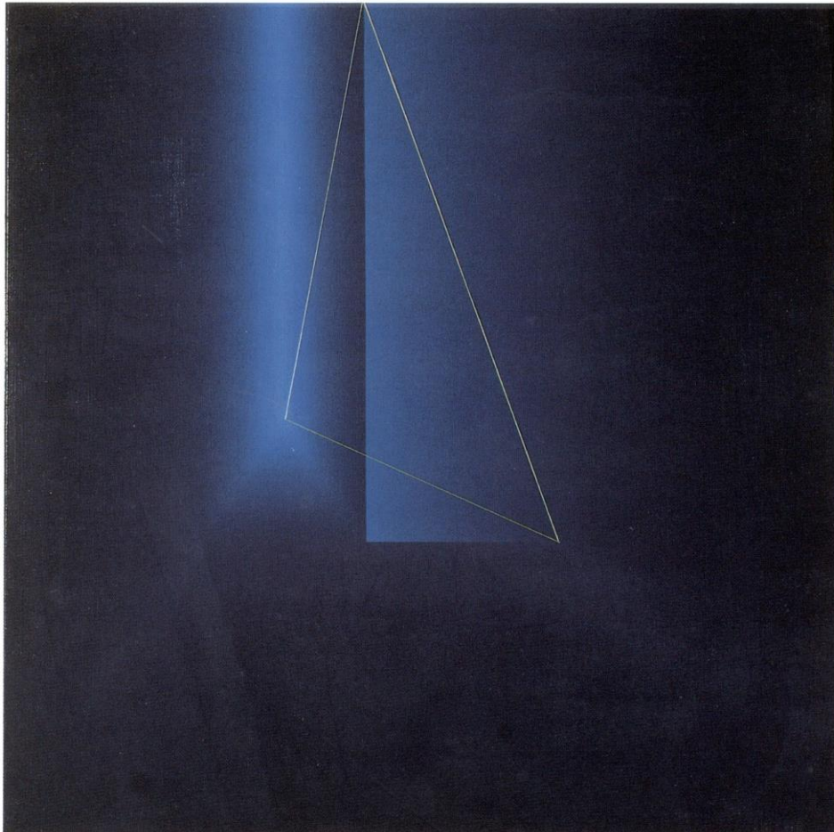
“Serie Toledo” 60 x 60 cm. Acrílico sobre lienzo 1977